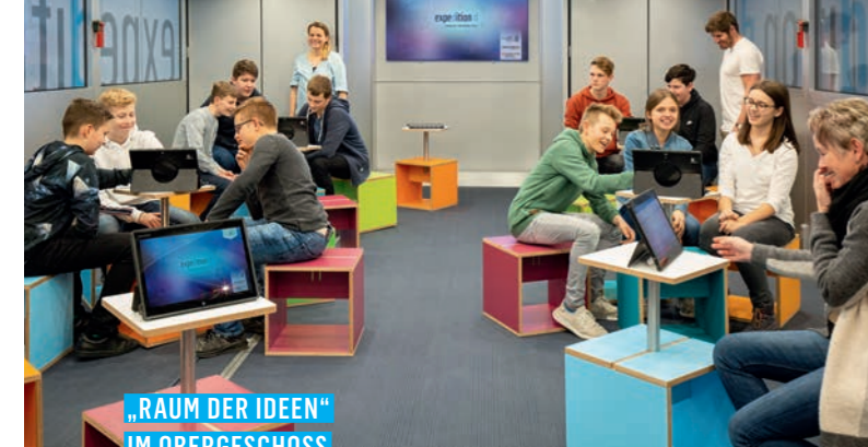
„RAUM DER IDEEN“ IM OBERGESCHOSS