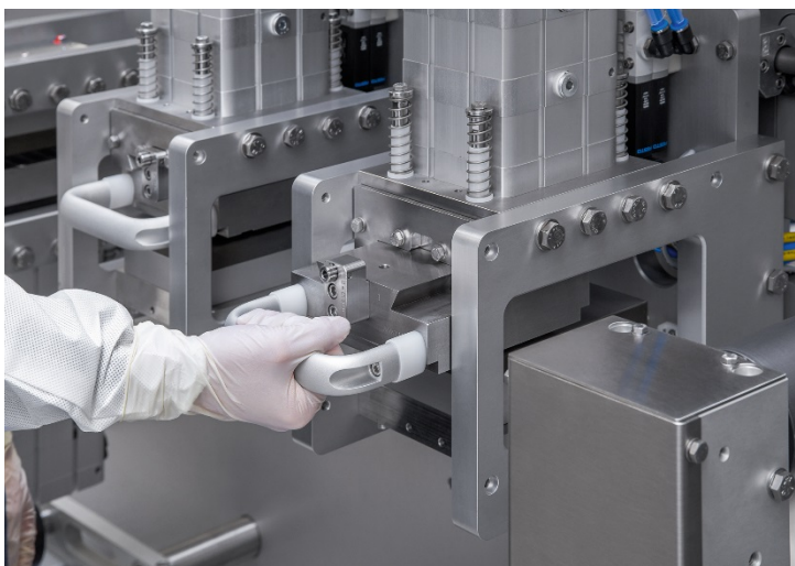
Wechsel von Schneidwerkzeugen an der OPTIMA TDC125