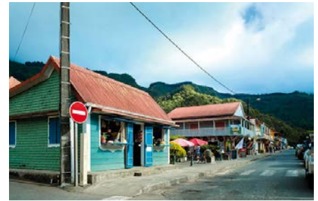
03 LAREUNION_HellBourg @IndianOcean.de

Der Panoramablick vom Kiosque du Cap Noir (über Le Port an der Nordwestküste aus erreichbar) bietet an wolkenfreien Tagen spektakuläre Postkartenblicke in den Cirque de Mafate mit dem steil im Talkessel aufragenden Piton Cabris.