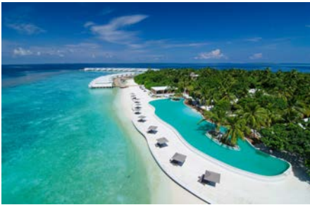
01 MAL_Hotel_AmillaFushi_Maldives_Pool01

High end luxury and holiday feeling, but with the comfort guests are used to at home. The luxury resort offers modern 'homes' over crystal clear waters and meters away from the magnificent house reef. Manta rays at the nearby Hanifaru Bay offer a memorable snorkel experience for guests who alternatively can explore the colourful house reef at their own leisure right on their doorstep.