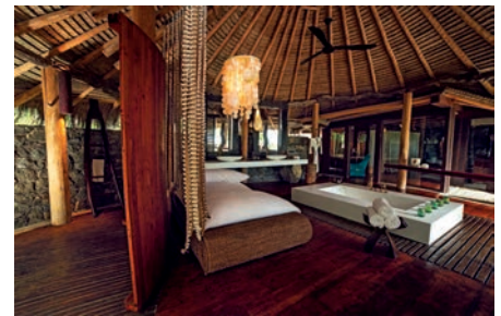
09 SEY_Hotel_NorthIsland-interior

„Barfuß-Luxus“ in Kombination mit Naturschutz. Drei Granitberge, eine üppige Vegetation und der türkisfarbene leuchtende Ozean bestimmen das Bild der etwa 3,4 x 2,2 Kilometer großen Insel und machen es zu einem tropischen Paradies mit einer Vielfalt an Pflanzen und Tieren.