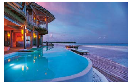
06 MAL_Hotel_SonevaJani_exterior

Ein Zufluchtsort nur für Erwachsene, egal ob über, unter oder am Wasser – Hurawalhi ist ein 5-Sterne-Genuss mit einer wunderbaren Mischung aus Ruhe und Geschäftigkeit. Das Highlight ist das imposante und weltweit größte, komplett verglaste Unterwasserrestaurant.