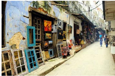
05 ZAN_StoneTown_Shops

Bunt und morbide zugleich wirkt Stone Town, die Altstadt von Sansibar-City und seit dem Jahr 2000 UNESCO-Weltkulturerbe. Hier pulsiert das Leben auf den engen Gassen, orientalisches und afrikanisches Flair verschmelzen zu einem Gesamtkunstwerk wie aus 1.001 Nacht.