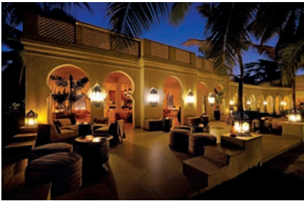
07 ZAN_Baraza_night @IndianOcean.de

Hgh end luxury and holiday feeling, but with the comfort guests are used to at home. The luxury resort offers modern 'homes' over crystal clear waters and meters away from the magnificent house reef. Manta rays at the nearby Hanifaru Bay offer a memorable snorkel experience for guests who alternatively can explore the colourful house reef at their own leisure right on their doorstep.