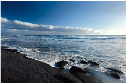
01 LAREUNION_Beach @IndianOcean.de

The only black sand beach on the island at Etang Salé les Bains is also very popular with locals.