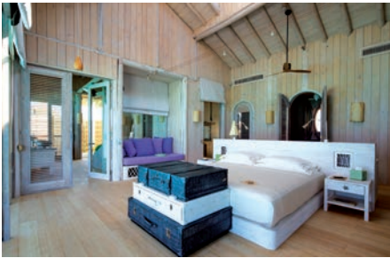
07 MAL_Hotel_SonevaJani_Overwater-Villa

The contemporary minimalist interior is elegantly styled in white-washed wood and clean lines, surrounded by glass windows revealing a splash of turquoise hues.