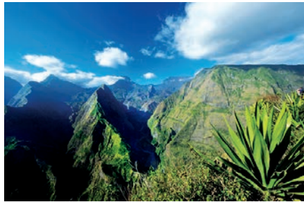
02 LAREUNION_CapNoir

Der einzige schwarze Sandstrand der Insel bei l'Étang-Salé-les-Bains ist vor allem bei Einheimischen sehr beliebt.