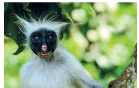
09 ZAN_ColobusMonkey @IndianOcean.de

Makunduchi an der Südwestküste ist eines von vielen authentischen Dörfern, wo die Menschen noch in einfachen Lehmhütten leben.