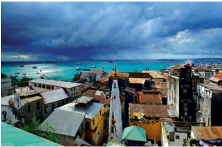
10 ZAN_Stonetown_Skyline

Stone Town is the colourful yet somewhat morbid historic centre of Zanzibar and a UNESCO World Heritage site since 2000. Life pulsates through the narrow streets with a blend of Oriental and African flair.