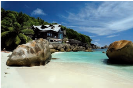
04 SEY_Beaches_Mahe_AnseTakamaka

Anse Takamaka is located in the peaceful south of the main island of Mahé with a hotel built in the typical local style and a beach bar serving good food.