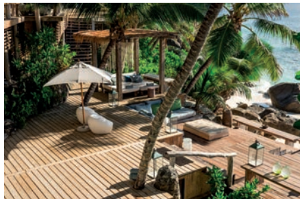
08 SEY_Hotel_NorthIsland @WildernessSafaria

Etwas abseits am Hang gelegen, verkörpert dieses Refugium mit 67 Villen und Suiten sowie 27 Residenzen die natürliche Einfachheit des Baumkronen-Lebens mit spektakulärem Blick auf die idyllische Bucht von Petite Anse.