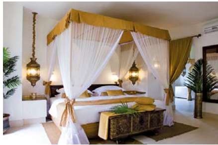
08 ZAN_Baraza_bedroom@TheZanzibar- Collection

Auf den Klippen gelegen, begeistert das „Zawadi“ mit einem atemberaubendem Blick über das Meer und einem privaten weißen Sandstrand. Ein „Barefoot“-Refugium mit nur neun privaten, geräumigen Luxusvillen für entspannte Eleganz.