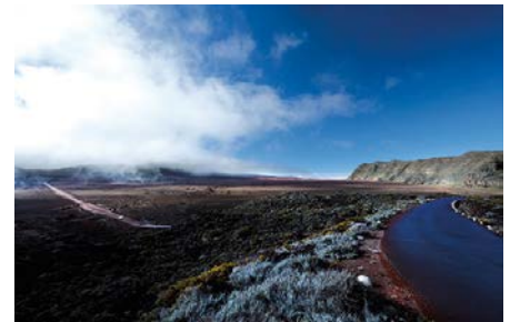
06 LAREUNION_Vulcan01 @IndianOcean.de

Von Saint-Gilles-les-Hauts an der Westküste aus ist der 2.205 Meter hohe Piton Maito über eine kurvenreiche Straße in gut einer Stunde zu erreichen. Die Aussicht in den Cirque de Mafate mit seinen steil aufragenden Felswänden ist atemberaubend.