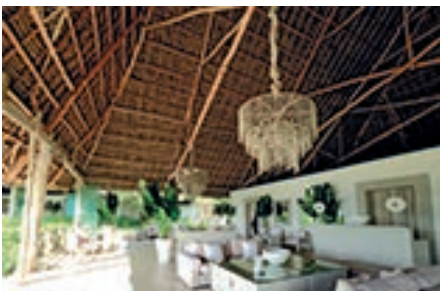
07 ZAN_HotelZawadi @IndianOcean.de

Highend-Luxus mit dem Komfort des eigenen Zuhauses. Die modernen Unterkünfte thronen über dem kristallklaren Wasser des Indischen Ozeans. Nur wenige Meter entfernt liegt das Hausriff, dessen Farbpracht zum Erkunden einlädt. In der nahegelegenen Hanifaru-Bucht wird das Schnorcheln mit Mantarochen zu einem unvergesslichen Erlebnis.