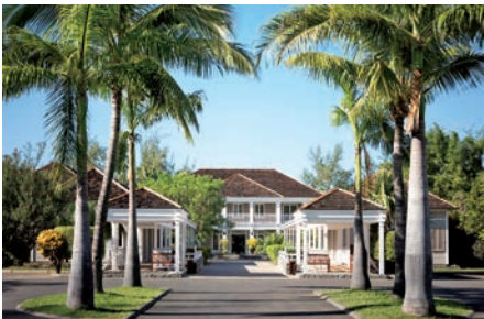
04 LAREUNION_Hotel_LUX_Saint_Gilles

Ursprünglich hatten hier entlaufene Sklaven Zuflucht in der unzugänglichen Bergwelt von La Réunion gesucht. Heute ist das Dörfchen Hell-Bourg mit hübschen Häusern im kreolischen Stil daraus geworden.