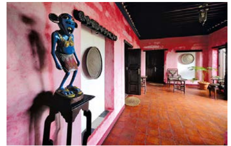
09 ZAN_Hotel_EmersonHurumzi

Die Ein- und Zwei-Zimmer-Villen verkörpern die klassische Swahili-Architektur mit luxuriöser Einrichtung, edlen Stoffen, handgeschnitzten Möbeln, Messinglaternen und vielem mehr.