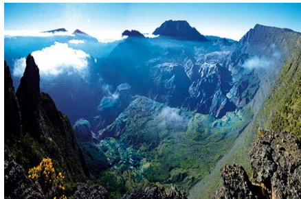
05 LAREUNION_Maido

Das einzige 5-Sterne-Hotel auf La Réunion mit direktem Zugang zu einem der schönsten Strände liegt an der klimatisch günstigen Westküste und ist ideal zum Entspannen am Meer und zum Erkunden der spektakulären Natur. Das Cap Noir, der Cirque de Mafate, der Vulkan im Süden und zwei Golfplätze sind von dort schnell erreichbar.