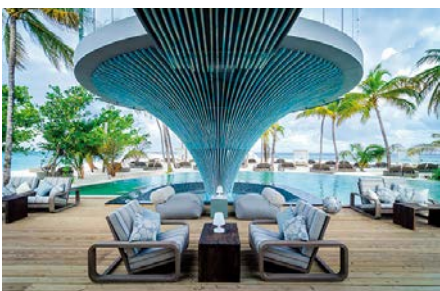
04 MAL_Hotel_Finolhu_Maldives

Der „Food Bazar“ am Pool bietet diverse kulinarische Erfahrungen aus der ganzen Welt. Das Over-Water-Restaurant „Feeling Koi“ verwöhnt die Gäste mit ausgewählten japanischen Gerichten. Die jüngste kulinarische Ergänzung ist der versteckte „Mystische Garten“ mit Skulpturen lokaler Künstler.