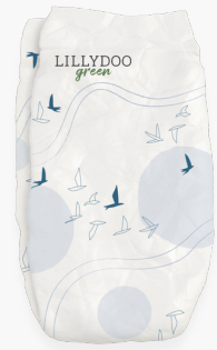
Up, Up and Away