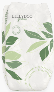
Watch Me Grow

LILLYDOO green ist ab Mitte Dezember dauerhaft in Deutschland, Österreich, der Schweiz, Frankreich, Italien, Spanien und den Niederlanden im Einzelkauf oder im flexiblen Abo unter www.lillydoo.com erhältlich. Die Designs der umweltfreundlichen Windellinie sind in Größe 1 bis 7 (Watch Me Grow) beziehungsweise Größe 3 bis 6 (Up, Up And Away) verfügbar. Das LILLYDOO Abo ermöglicht es Mamas und Papas, ihre Bestellung individuell zu konfigurieren und darin Windeln von LILLYDOO green mit allen anderen Windellinien zu kombinieren.