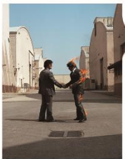
Pink Floyd, Wish You Were Here , 1975 Design: Hipgnosis – Aubrey Powell / Storm Thorgerson