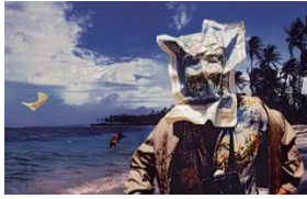
10cc, Bloody Tourists , 1978 Design: Hipgnosis – Aubrey Powell / Storm Thorgerson, Foto: Aubrey Powell © Hipgnosis