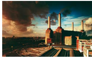
Pink Floyd, Animals , 1977 Design: Roger Waters, Foto: Aubrey Powell © Pink Floyd Music Ltd