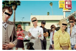
ACDC, Dirty Deeds Done Dirt Cheap , 1976 Design: Hipgnosis – Aubrey Powell / Storm Thorgerson