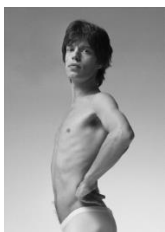
Mick Jagger, 1973