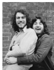
Aubrey Powell und Storm Thorgerson © Hipgnosis